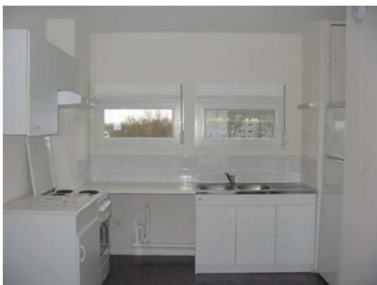
cuisine d'un T4

- La MOUS est financée à 100% par l'Etat pour une durée de 3 ans.