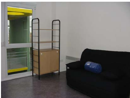
séjour d'un T1